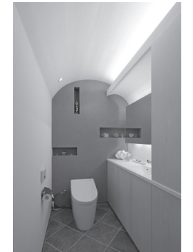
施工：ギャラリー・コア